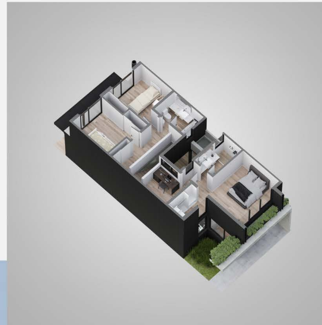
Planta alta tipología 1A