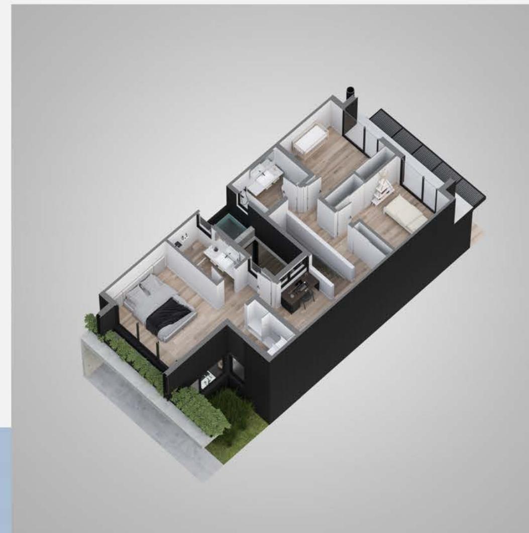
Planta alta tipologia 1B