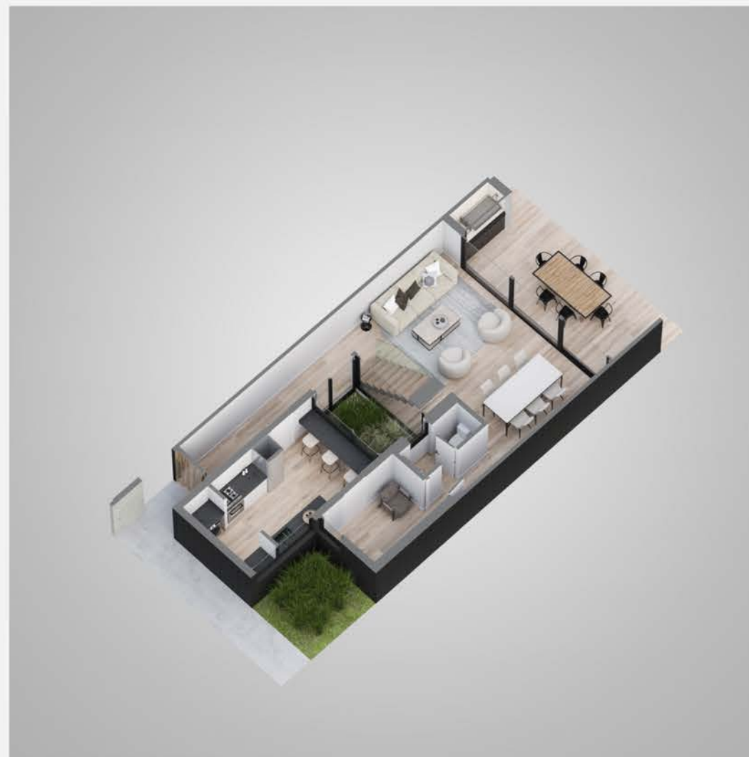
Planta baja tipologia1B