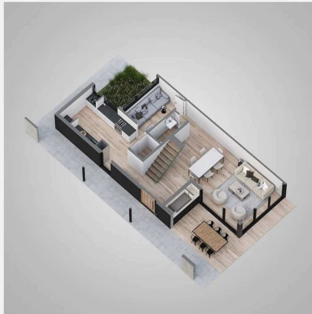
Planta baja tipologia 1C