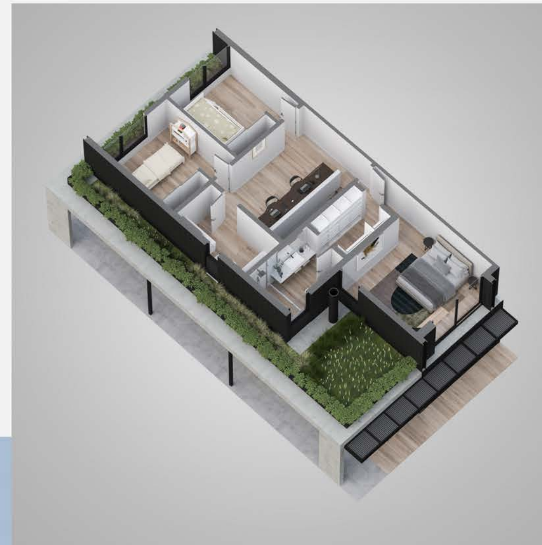
Planta alta tipologia 1C