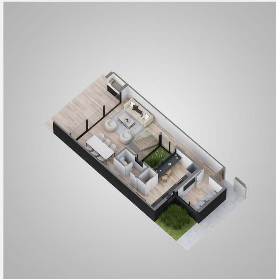
Planta baja tipología 1A